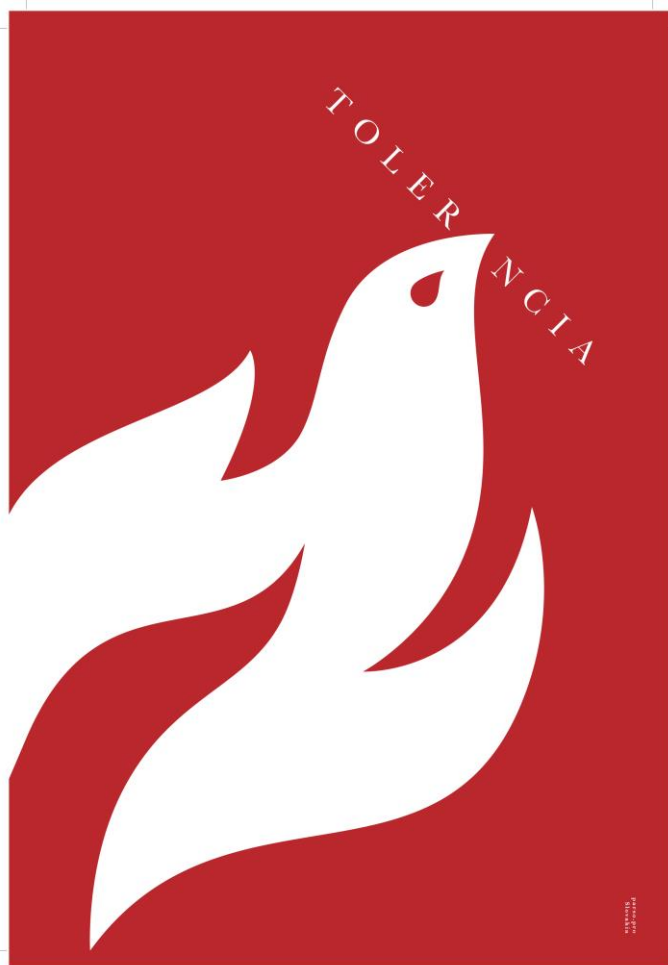
Vizuál k výstave od Róberta Parša

Výnimočnú putovnú výstavu plagátov – Tolerancia môžete navštíviť na bratislavskom Moste SNP od 16.8. do 7.10.2020.