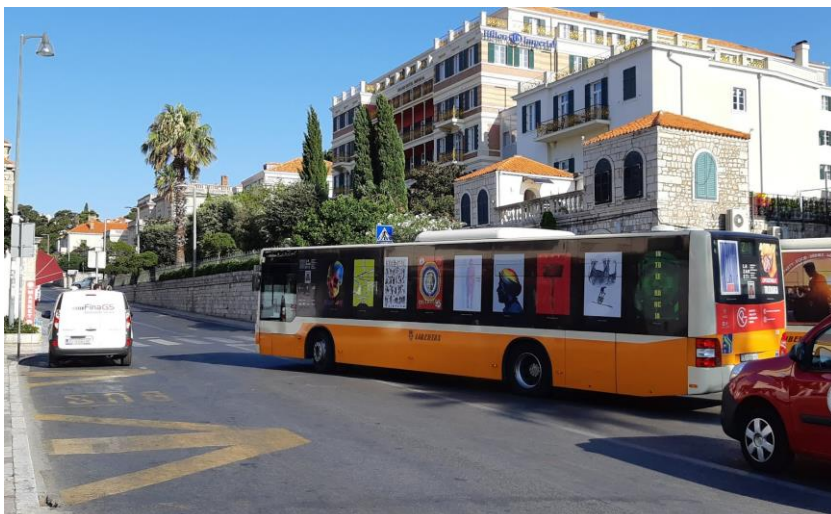
Dubrovnik, Chorvátsko