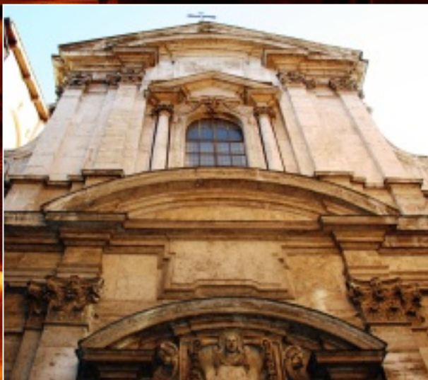
PRIEČELIE KOSTOLA SAN GIROLAMO DELLA CARITÀ NA VIA DI MONSERRATO 62 A, KDE SA V NEDELU POPOLNÍ SLUŽIA OMŠE V SLOVENČINE. INFORMÁCIE POSKYTUJE WEBSTRÁNKA SLOVENSKEJ KATOLÍCKEJ MISIE V RÍME, KTORÁ TU PÔSOBÍ UŽ VIAC AKO PÄT ROKOV A SPOLUPRACUJE S Vatikánskym rozhlasom.