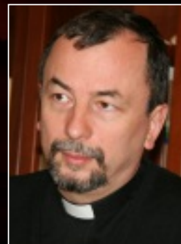
DVE VEĽKÉ OSOBNOSTI CIRKVI POCHÁDZAJÚCE ZO SLOVENSKA: KARDINÁL JOZEF TOMKO (VLAVO) A ARCIBISKUP CYRIL VASIL, SEKRETÁR KONGREGÁCIE PRE VÝCHODNÉ CIRKVI.